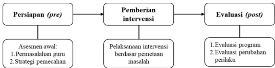
Gambar 1. Tahapan kegiatan PPM

Pada tahap persiapan, dilakukan asesmen kebutuhan awal dan keadaan awal subjek sasaran untuk mendeteksi secara tepat permasalahan yang dihadapi guru di MI An-Nuur Sleman selama pelaksanaan pembelajaran online . Asesmen atau pengukuran awal dilakukan dengan memberikan kuesioner terbuka ( open-ended questionnaire ) untuk mengetahui permasalahan yang dihadapi dan strategi yang digunakan untuk menangani ( coping strategy ). Setelah diidentifikasi masalah utama pada guru, kemudian disusun intervensi yang sesuai.